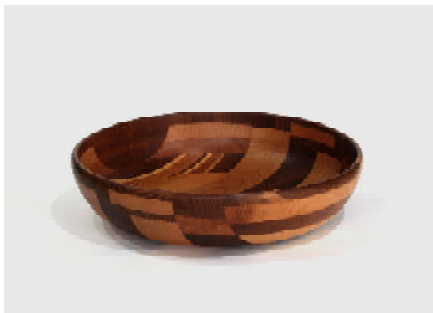
Große Schale, Eiche, Esche, Ahorn, Mahagoni verleimt, H: 12,2 D: 50cm