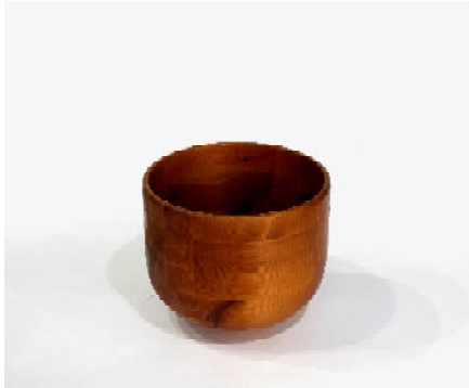
Große Schale, Kiefer verleimt H: 23,5 D: 26,5cm