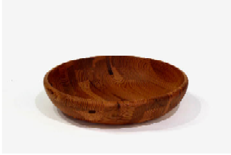
Große Schale, Kiefer verleimt H: 10 D: 46cm