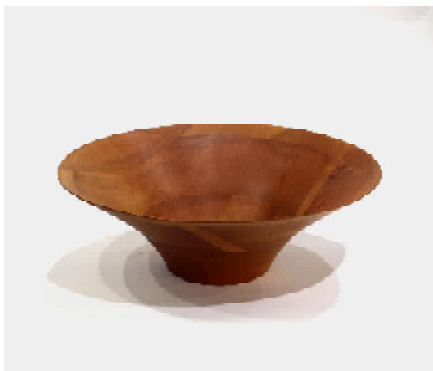
Große konische Schale, Erle verleimt, H: 17,8 D: 53cm